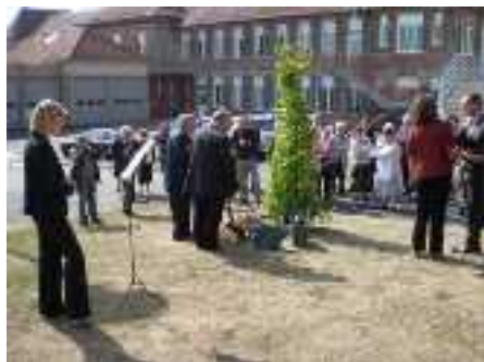
Plantation du Ginkgo Biloba

Après cette première partie des cérémonies, des autocars ont transporté les participants au Centre hospitalier de Beauvais. Symboliquement face au bâtiment de l'école d'infirmières, un Ginkgo Biloba a été planté (on va le considérer comme un cousin de celui de la cour intérieure de Charles-Nicolle !) et une très belle et élégante stèle en l'honneur des donneurs a été dévoilée, notamment très symboliquement par une transplantée cardiaque, accompagnée d'une mélodie de l'opéra Orphée de Glück interprétée à la flûte par une jeune femme musicienne et conseillère municipale de Beauvais.