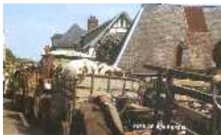
Dans la remorque, une ou deux bêtes attendent leur tour

Au Marais-Vernier limitrophe de Ste Opportune, village magnifique au printemps avec ses pommiers en fleurs ses toits de chaume, le 1er mai de chaque année a lieu la fête de l'étampage. Tradition née au temps de la révolution, lorsque les terres seigneuriales furent confisquées et devinrent biens communaux. Le village reçut ainsi plusieurs centaines d'hectares de vertes prairies. Une manne pour ces paysans du cru. Mais fallait-il pouvoir identifier le bétail avant de le laisser paître à loisir. D'où le recensement des bovins appartenant aux éleveurs de la commune au début du printemps, suivi du marquage ou étampage, avant la mise au pré. On utilise des fers rouges qu'on applique sur les cornes, donc insensibles et indolores avec les initiales M.V. : Marais-Vernier.