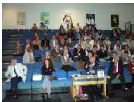
Vue des participants

Après cette projection, la parole a été donnée afin de témoigner à des bénévoles de l'ADOT et à des transplantés.