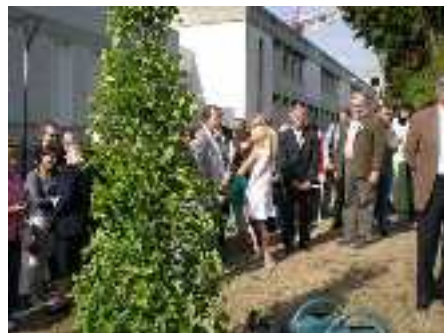
Le Ginkgo Biloba