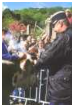
Fer en main, invités et personnalités locales se succèdent pour marquer les cornes des animaux