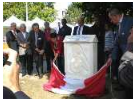
Inauguration de la stèle