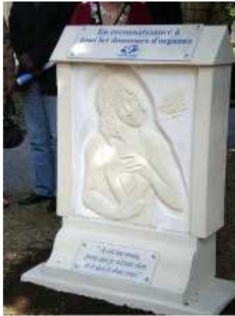
Stèle en l'honneur des donneurs (A cet inconnu pour qui je n'étais rien et à qui je dois tout)

Nous sommes ensuite revenus à la salle de réunion des manifestations matinales pour un déjeuner avec tous les participants. Nous avons eu le plaisir d'avoir à notre table la dame transplantée cardiaque (à Paris) qui a dévoilé la stèle, très sympathique et très vivante.