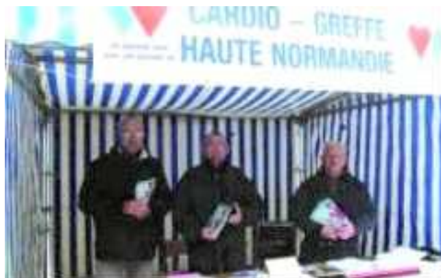
Le stand à Fécamp