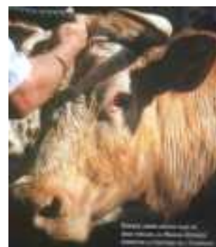
Chaque année depuis plus de deux siècles, le Marais-Vernier perpétue la coutume de l'étampage