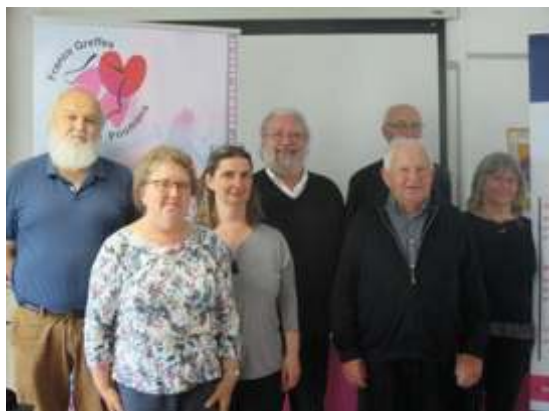
Les bénévoles, membres du bureau

Un excellent déjeuner convivial à « La Fontaine gourmande » a clôturé cette assemblée 2019.