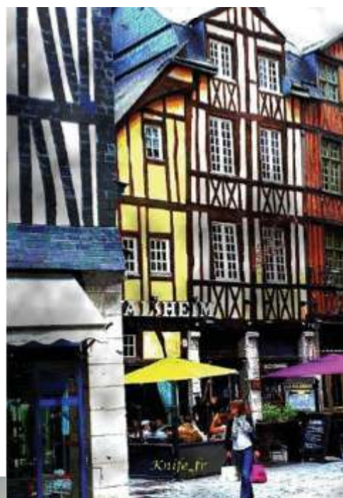
Rue Damiette, lors de notre déambulation dans ROUEN