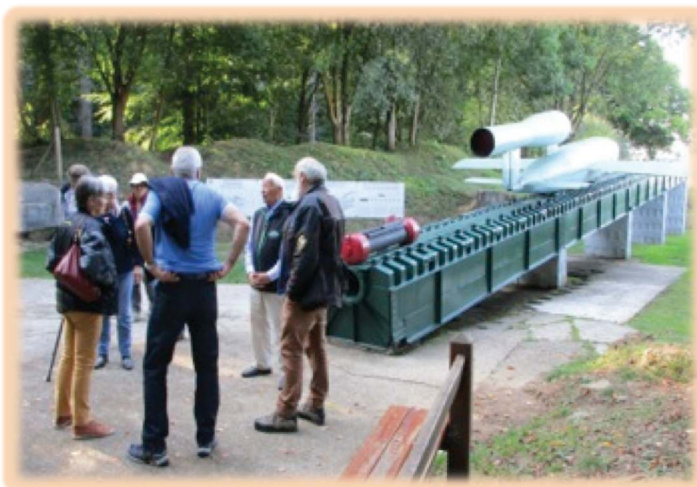
En compagnie du responsable de l'association de sauvegarde du site, riche d'anecdotes

âgé de 96 ans aujourd'hui et qui a été témoin de cette période. Il nous a décrit les activités de