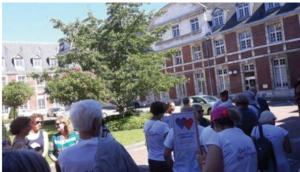
Arrivée cour d'honneur du CHU Le Gingko biloba