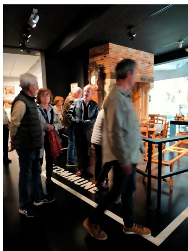
Notre groupe face à une scénographie illustrant l'intérieur des maisons de pêcheur au XIX ème siècle

Un évènement inattendu est survenu au cours de notre visite, interrompant notre conférencière : en effet, une alarme incendie s'étant déclenchée, le musée a été immédiatement évacué jusqu'à l'arrivée des pompiers. Nous nous sommes finalement séparés sur le quai pour la majeure partie d'entre nous, avant la réouverture du musée notre visite étant quasiment terminée.