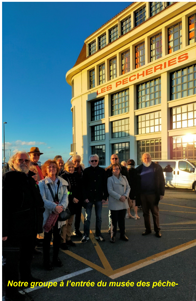
Notre groupe à l'entrée du musée des pêche-

L'après-midi était donc consacré à la visite des «pêcheries de Fécamp ». Notre guide ,nous a d'abord conduit au belvédère, cinquième étage du musée, où nous avons bénéficié d'un panorama à 360° sur la ville et l'horizon maritime.