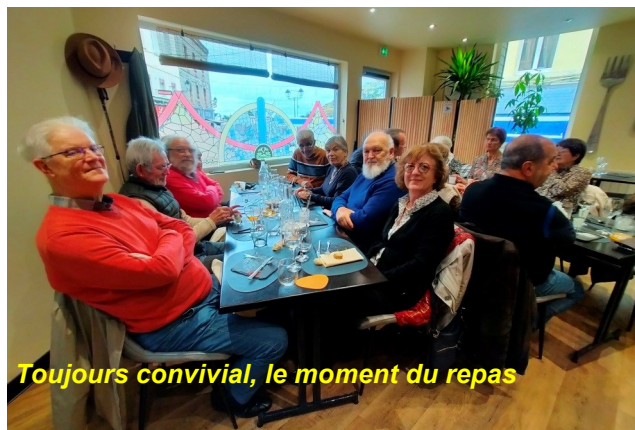
Toujours convivial, le moment du repas

Nous étions seize participants à nous retrouver au restaurant « Le Daniel's », comme un clin d'œil à notre cher président, pour partager un excellent repas, apprécié de tous.