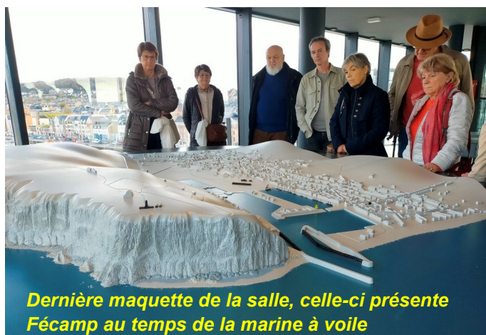
Dernière maquette de la salle, celle-ci présente Fécamp au temps de la marine à voile

Nous nous sommes ensuite rendus dans la salle consacrée aux différentes pêches pratiquées autrefois et encore de nos jours. La pêche aux harengs et celle de la morue par les terre-neuvas.